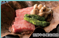
飛騨牛朴葉味噌焼