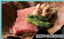
飛騨牛朴葉味噌焼

●飛騨牛ステーキ ●飛騨牛すき焼き ●飛騨牛ハンバーガー ●飛騨牛朴葉味噌焼 ●ぶりしゃぶ