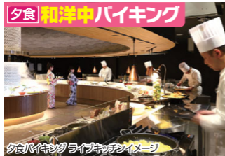
夕食バイキング ライブキッチンイメージ